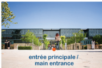
entrée principale / main entrance